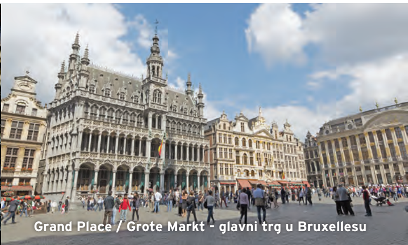
Grand Place / Grote Markt - glavni trg u Bruxellesu