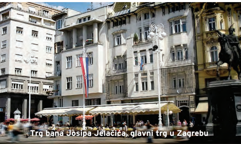
Trg bana Josipa Jelčića, glavni trg u Zagrebu

16. I 17. OŽUJKA 2016. ESPLANADE ZAGREB HOTEL